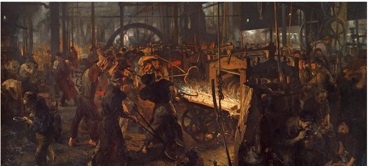
Adolph Menzel - La fornace con il laminatoio - Moderni Ciclopi